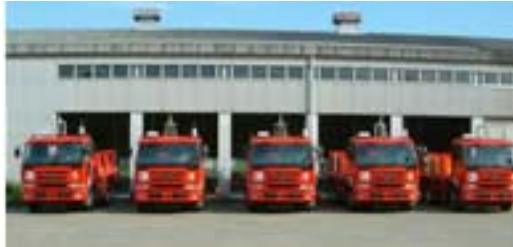
舗装走行実験場(無人荷重車)