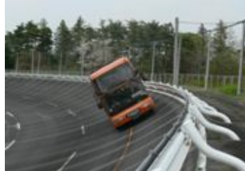
試験走路で高速走行体験