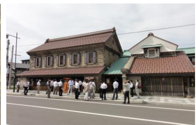
写真-5 増毛町での現地指導の例