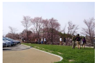
写真-3 駐車区画を削減した部分 の舗装仕上げと利用風景