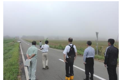
写真-1 植栽地点の検討風景 (現地指導)