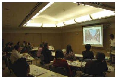
写真-4 芽室町での講演の例