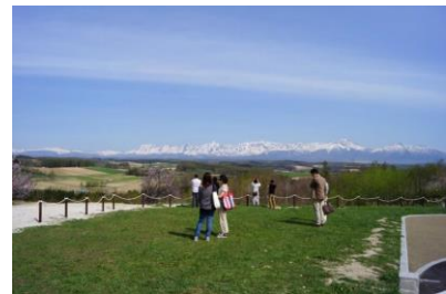
写真-2 整備後の広場と 十勝岳連峰への眺望