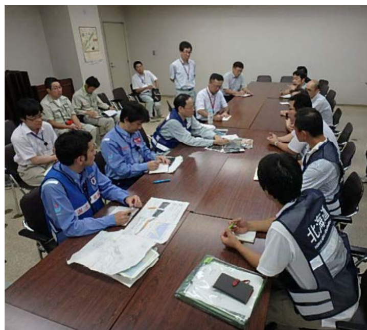
北海道・町への説明状況