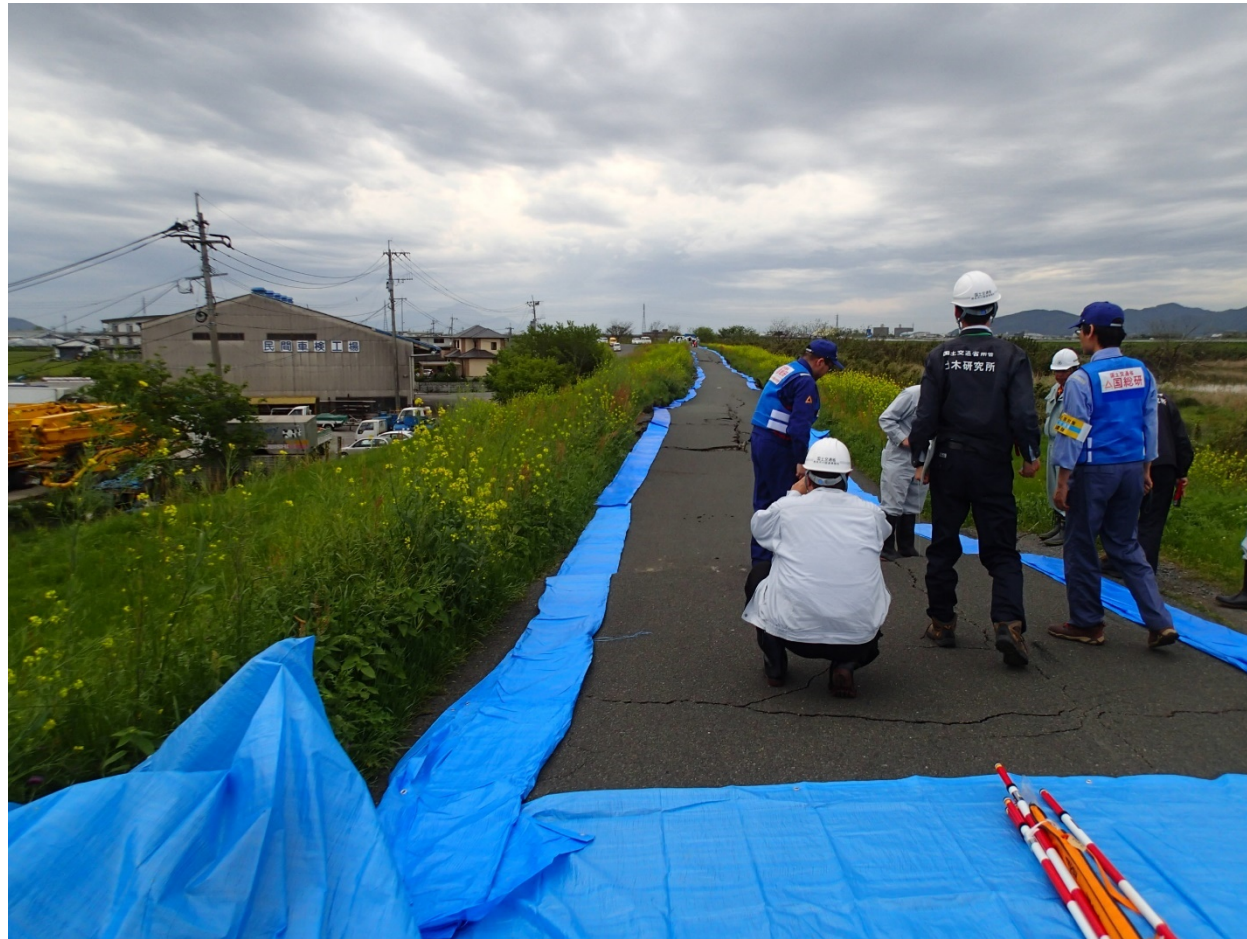
緑川の堤防被災箇所において地方整備局職員と被災状況調査を行う土研土質・振動チーム上席研究員(4月16日)