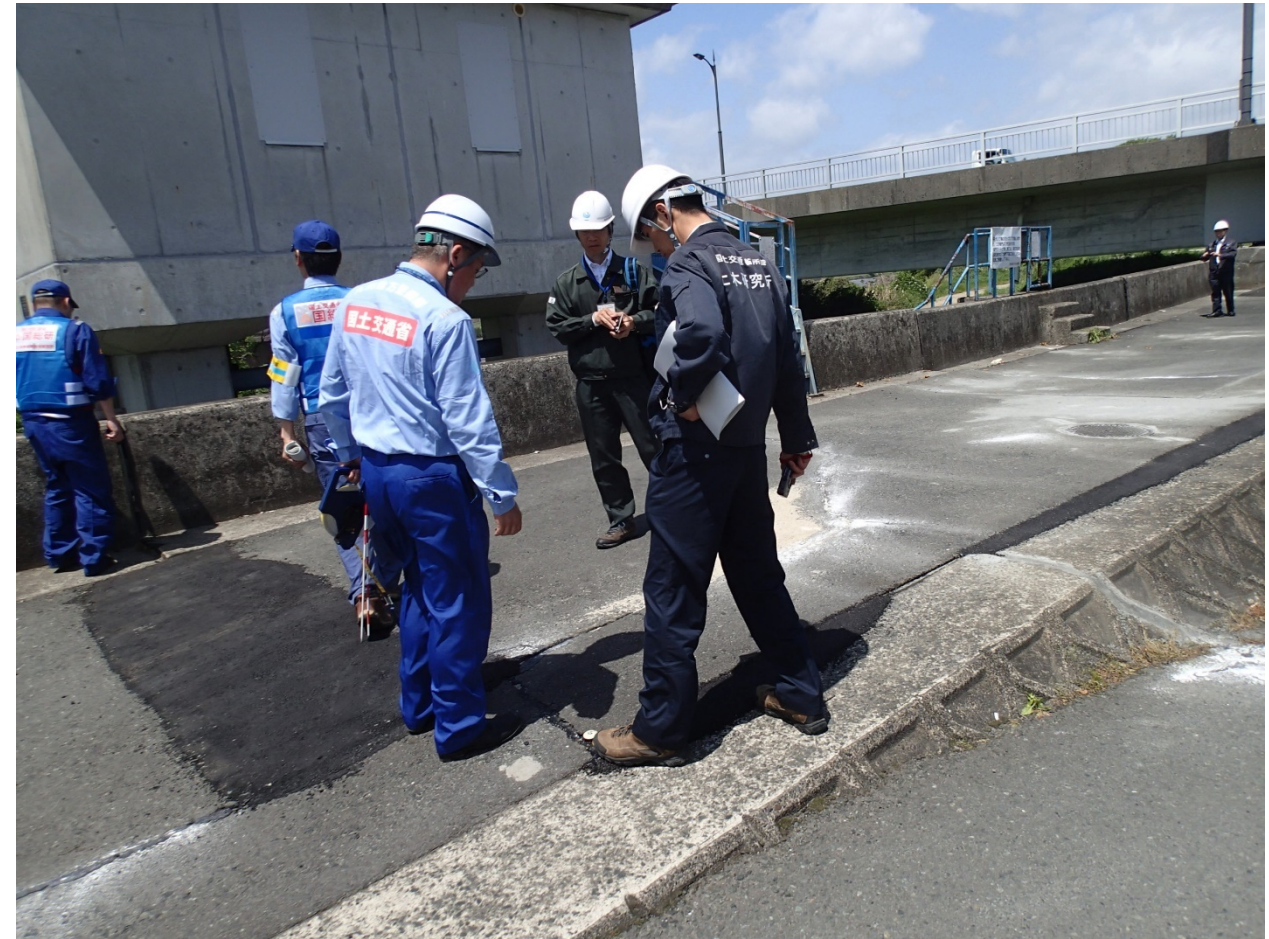
白川の樋管抜け上がり箇所において地方整備局職員と被災状況調査を行う土研土質・振動チーム上席研究員(4月17日)