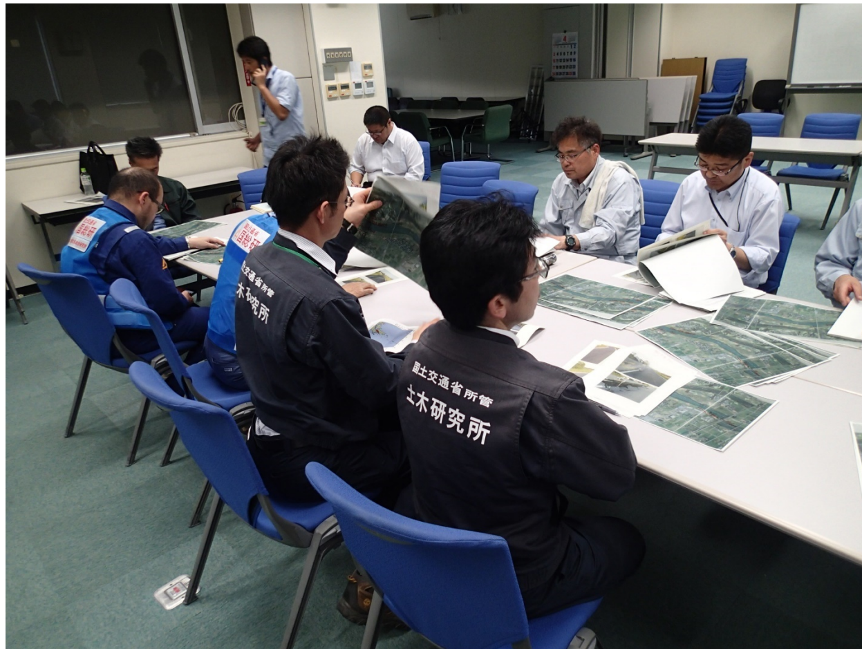
緑川, 白川の堤防被災箇所への復旧について技術指導を行う土研土質・振動チーム上席研究員