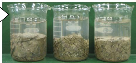
写真-1 浸水崩壊度試験の結果