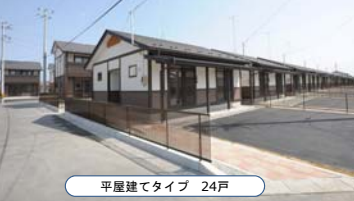
平屋建てタイプ 24戸