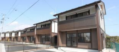
二階建てタイプ 24戸