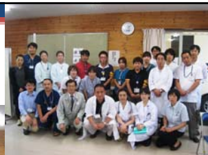
ご支援いただいた医療関係者の皆さん