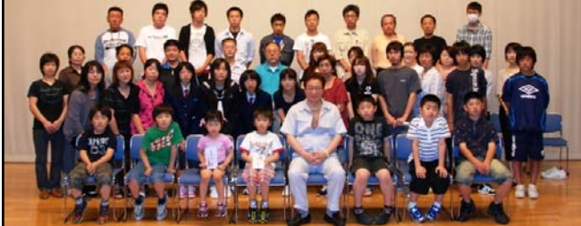
H24.6月改正条例案 大学・専修学校入学者に76,000円/月の奨学資金を支給