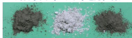
ポルトランドセメント 高炉スラグ微粉末 フライアッシュ