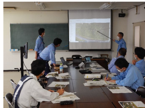
CIMを用いた現地調査結果の打合せ(8月18日)