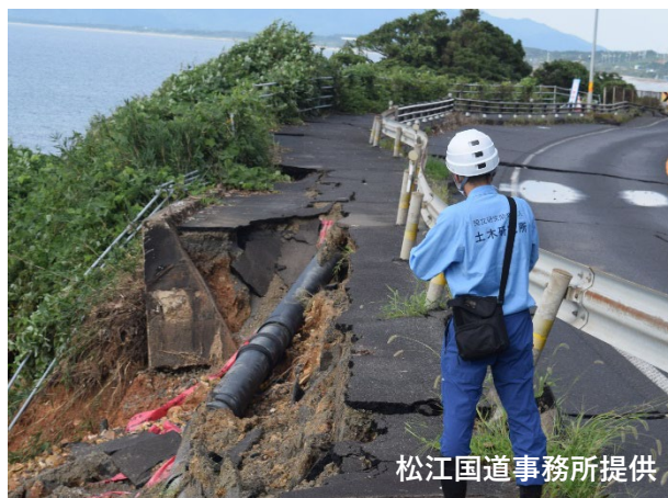
災害現地調査(8月18日)