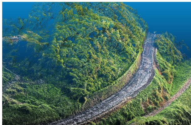
地すべり災害対応のCIMモデル(拡大)