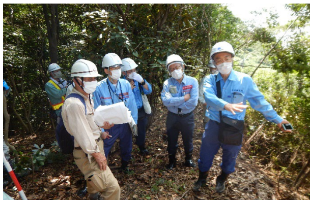
災害現地調査(8月18日)