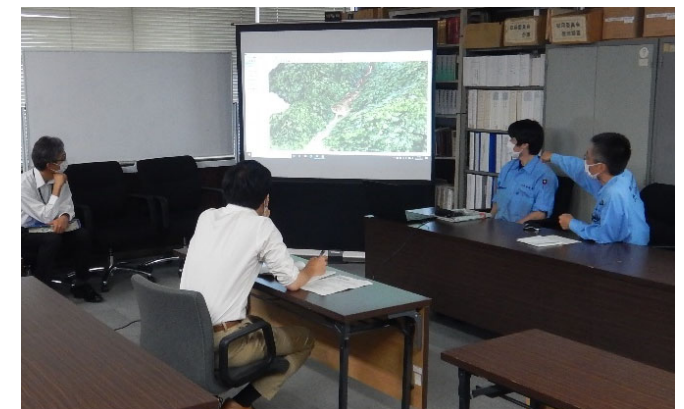
CIMモデルを用いた記者会見(7月21日)