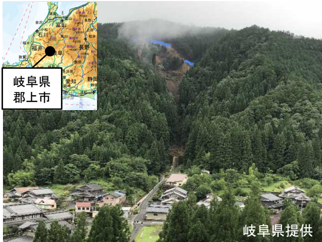
発災直後のUAV写真(7月8日撮影)