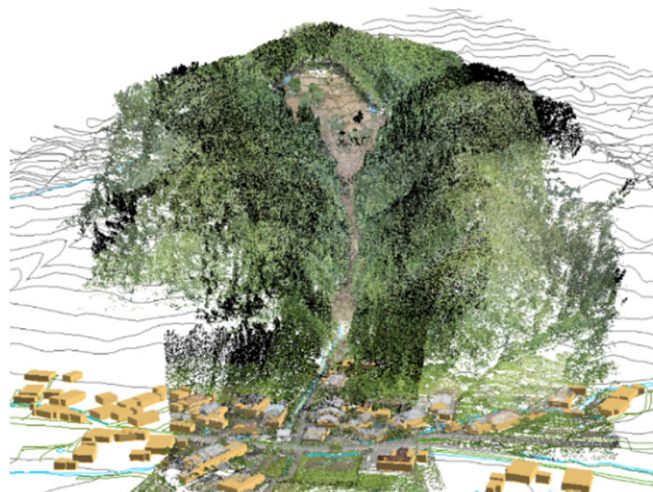
地すべり災害対応のCIMモデル