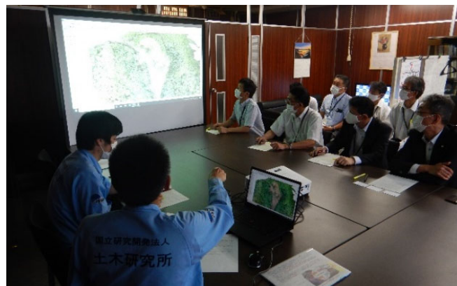
CIMモデルを用いた調査結果説明(7月21日)