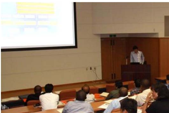
インセプションレポート発表会