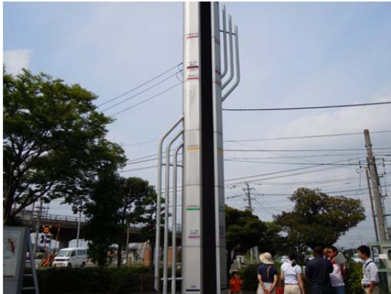
久喜市栗橋支所の利根川水位塔