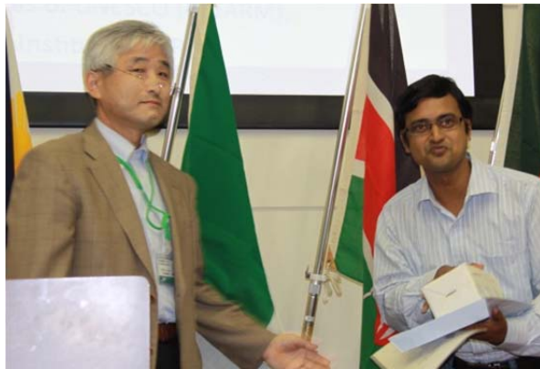
Sontoku Award 授与