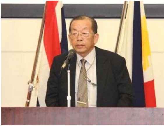
魚本理事長からの祝辞