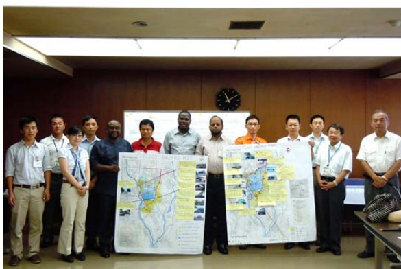
筑西市での発表会