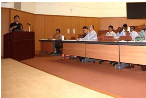
本永専門研究員による講義