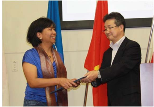
木邨所長からの修了書の授与