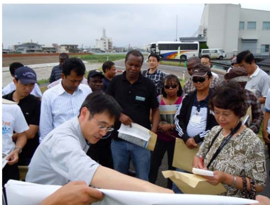
五十嵐川にて築堤部のご説明