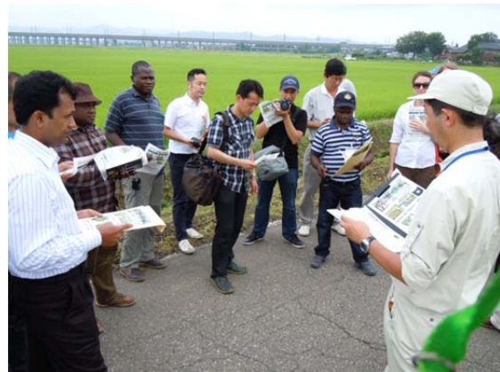
見附市の田んぼダムのご説明