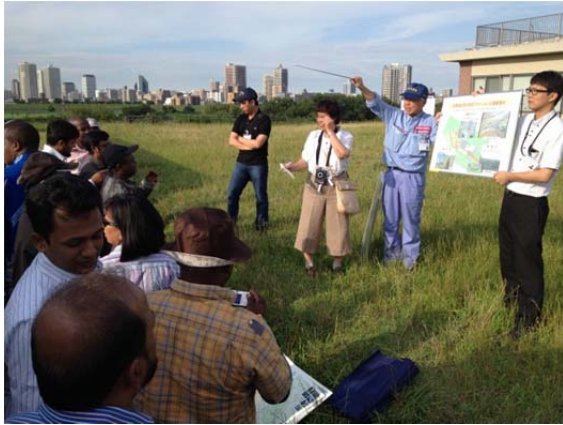
浮間防災ステーション