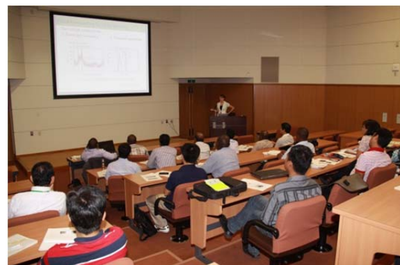
Kibler 専門研究員による講義