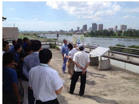
荒川下流河川事務所屋上での説明