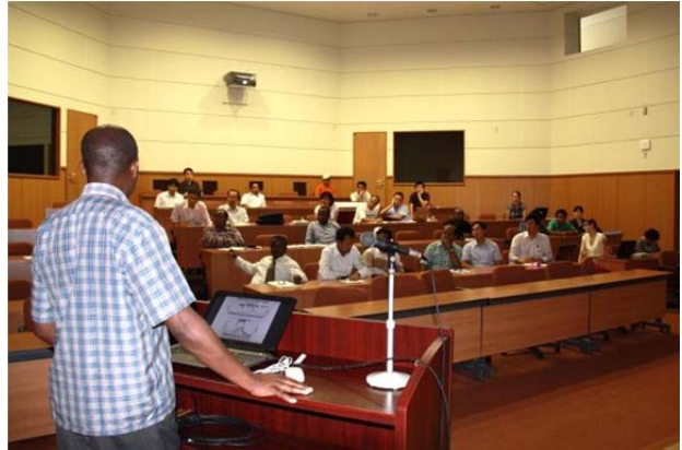
IFAS・TW 演習成果発表会

8月1日からは、本格的にアクションプランの作成に取り組み、研修最終日の6日にはアクションプラン発表会を開催しました。研修生は、PCM演習で学んだ手法をもとに、それぞれが対象とする流域での問題点を分析し、どのように解決に結びつけるかを、本研修で学んだことを参考にしながら発表を行いました。なお、帰国後も、発表会を開催したり、所属組織の上司と相談したりしながら内容を修正し、今年11月中旬までに再度提出することとなっています。