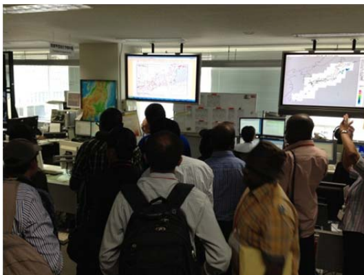
気象庁予報現業室

19日は、気象庁を訪問し、我が国の気象業務概要と洪水予報についての講義を受け、さらに予報現業室を見学しました。研修生からは雨量観測システムについてなど活発な質問が行われていました。その後、我が国の大都市における洪水対策の実情を視察するため、国土交通省荒川下流河川事務所のご協力のもと、荒川知水資料館「amoa」を訪問し、荒川の概要や放水路としての歴史などをご説明頂いた後に災害対策室で講義を受けました。その後は、浮間防災ステーション、新田スーパー堤防を視察しました。