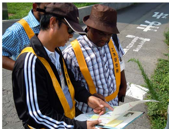
筑西市における TW の様子