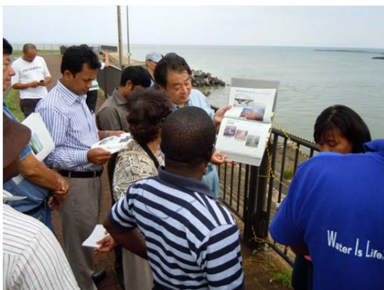
関屋放水路（新潟大堰）