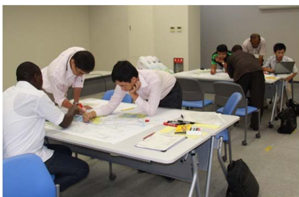
防災マップ作成演習