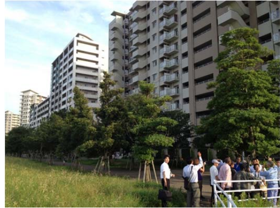
新田スーパー堤防

21日から23日にかけては、平成16年7月ならびに平成23年7月に甚大な豪雨災害を受けた新潟県を訪問し、信濃川下流域における洪水対策を視察しました。視察の主な目的は、平成16年災害後の各種対策による被害軽減効果や残る課題などに関して、直接のご担当者から講義・説明を受け、併せて現地の洪水対策施設を視察することで、洪水対策に関する我が国の知見・教訓