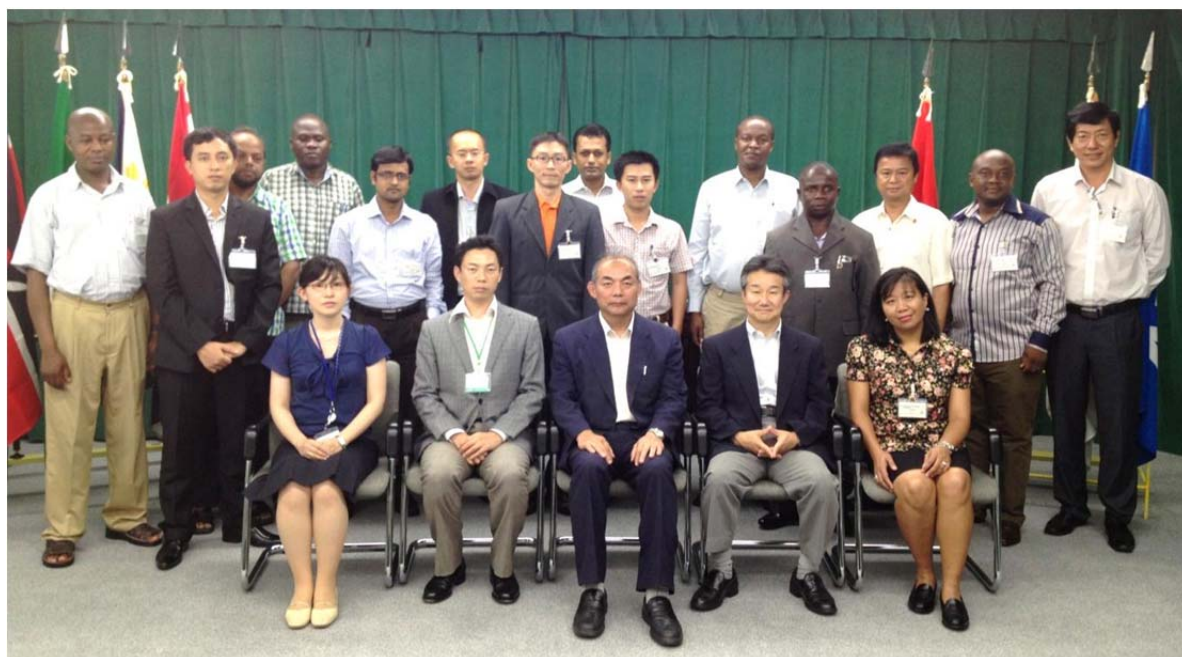
開講式後の集合写真