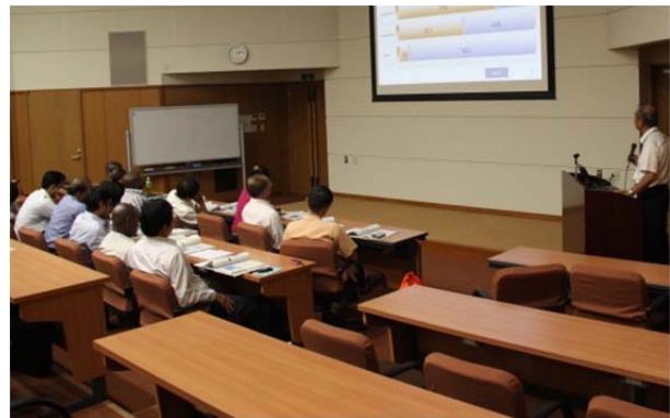
加本上席研究員による講義