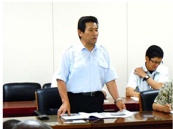
三条市消防団長との意見交換