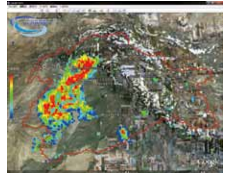
Precipitation distribution over the Indus river basin in Pakistan on July 2010. (created based on JAXA's GSMaP NRT, a satellite observation rainfall data, and corrected by ICHARM)

ICHARM and JAXA are participating in this project to further promote capacity development in flood forecasting and early warning and flood management over the Indus river basin jointly with Pakistan's government agencies such as the Pakistan Metrological Department, the Pakistan Space and Upper Atmosphere Research Commission and the Federal Flood Commission.