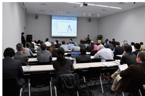
One of the parallel sessions at the Akihabara UDX on 28 September.