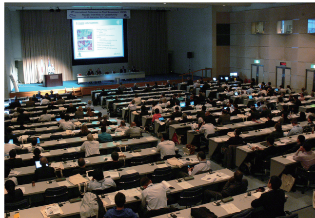
Plenary Session 1 at the UNU on 27 September.