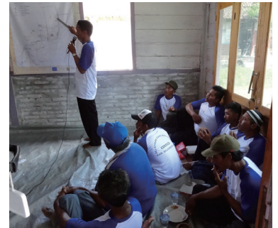
Led by the leader, the community in Kedung Sumber Village discusses the standard operation procedure for evacuation in reference to the hazard and evacuation map.

(Written by Dinar Istiyanto Project led by Toshio Okazumi)