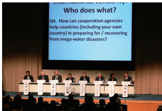
High Level Expert Panel Discussion.