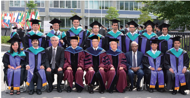
The graduating students and faculty members pose for photos at GRIPS (16 September 2011).

finally met the graduating requirements and obtained a Master's degree in disaster management. After the graduation ceremony, the new graduates proudly returned to their home countries with their enhanced expertise.