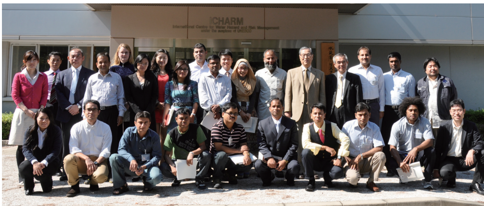
New students and ICHARM staff after the joint opening ceremony.

We will update you on the programs in future ICHARM Newsletters.