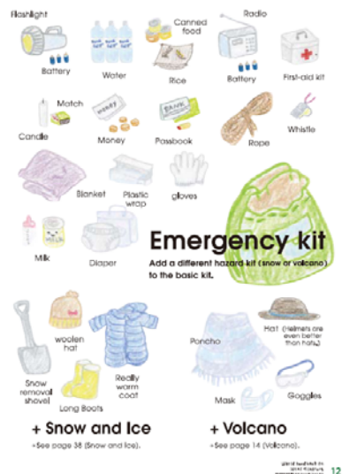
図-4 コラムには防災に役立つ知恵を記載 (緊急避難キット)