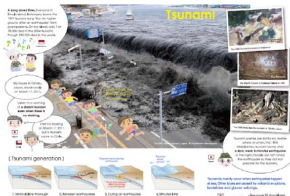
図-3 津波の説明ページ

本研究はある地域の防災経験を他地域へ適応、適用を可能とするための様々な調査を行い、分類されたハザードのタイプ毎に、適用にあたっての条件、期待さ