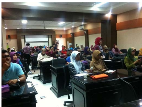
写真-1 防災ハンドブックを活用した防災教育トレーニング（インドネシア，2013. 3）

れる機能、適応のタイミング等を整理し、子供からお年寄りにも幅広く使ってもらうよう、わかりやすいハンドブックの形に作成した。このような多様なハザードの防災ハンドブックは例がないことから、多くの機関で好評を博している。