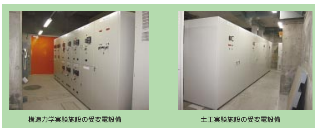
構造力学実験施設の受変電設備