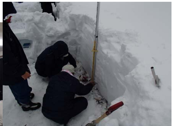
積雪観測実習の様子