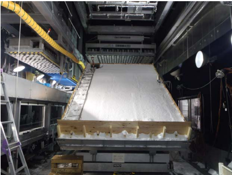
作成した多層構造の積雪と実験装置

1月28日から2月1日に、(独)防災科学技術研究所 雪氷防災研究センター新庄支所（山形県新庄市）の雪氷防災実験棟低温室において、降雨による湿雪雪崩の発生に関する実験を行いました。