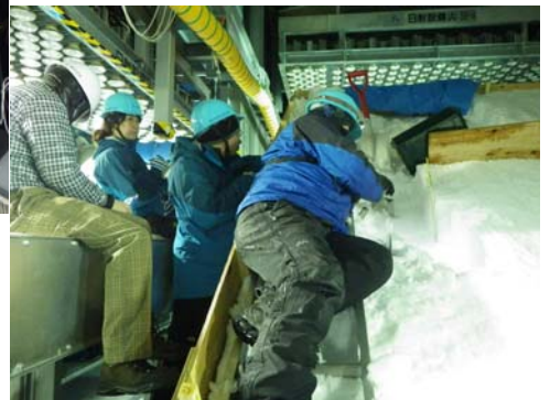
積雪構造の観察の様子