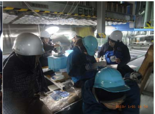
積雪層の含水率測定の様子

これは同研究所との共同研究「降雨による湿雪雪崩の発生機構に関する研究(2)」の実験であり、当センターから5名、札幌の寒地土木研究所から3名、防災科学技術研究所から3名が参加しています。実験では、傾斜させた多層構造の積雪に降雨装置による水分を浸透させ、積雪構造変化の観察、密度・含水率等の測定を行いました。