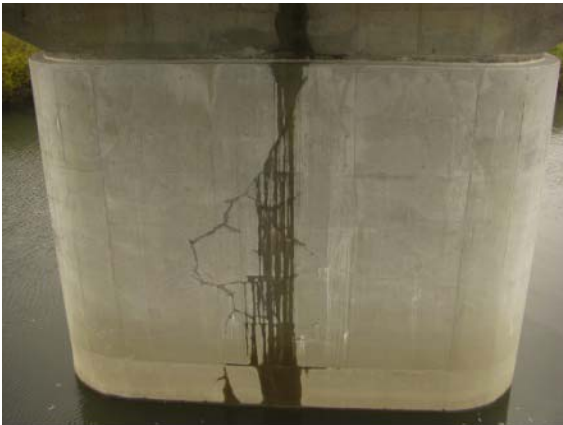
写真 3.15 卷立て RC のひび割れ (小判型橋脚)