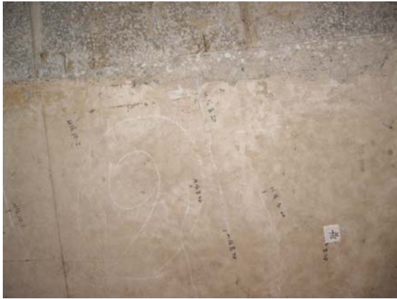
写真 3.2 補修箇所の現状