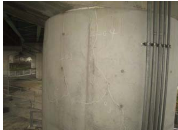
写真 3.16 卷立て RC のひび割れ (円柱橋脚)

のシーリング工の施工について検討課題があると考えられる。本橋脚では特に、鋼板取付けのための皿ボルトの設置間隔が通常よりも密であることから、シーリングによる保護がその後の鋼板の劣化対策として重要になるものと考えられる。