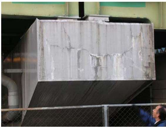
写真 3.11 橋脚梁部の再劣化（塗膜の割れ）

フォローアップ調査の結果としては、写真 3.10 に示すようにリチウム注入による補修箇所において、膨張が継続していると見られる表面塗膜のひび割れが認められる箇所があった。また、それ以外にも、写真 3.11 に示すように、補修箇所のなかには内部コンクリートの膨張によるものと考えられる、再劣化した箇所が見られた。リチウム注入工法の補修効果については明確とはなっていないが、Li/Na イオン比を大きくする必要があるので、海砂として多量の Na イオンが混入している場合に補修効果を得るのは容易でないと考えられる。