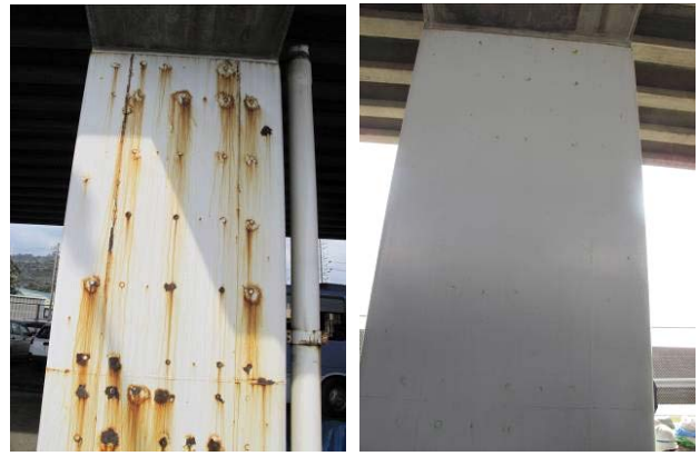
写真 3.12 腐食状況の差異（左：海側、右：陸側）