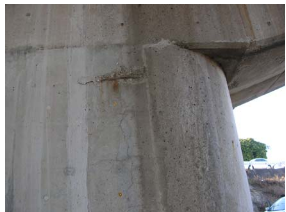
写真 3.9 鉄筋の露出、錆汁の流出

フォローアップ調査の結果としては、写真 3.8 に示すように補修が行われていない部位が橋脚柱部等で見られ、写真 3.9 に示すように腐食により断面欠損した鉄筋の露出が見られる箇所もあった。全体にかぶりが小さいように見られ、長期的には塩害による鉄筋腐食が耐力に影響を及ぼす恐れがあると考えられる。