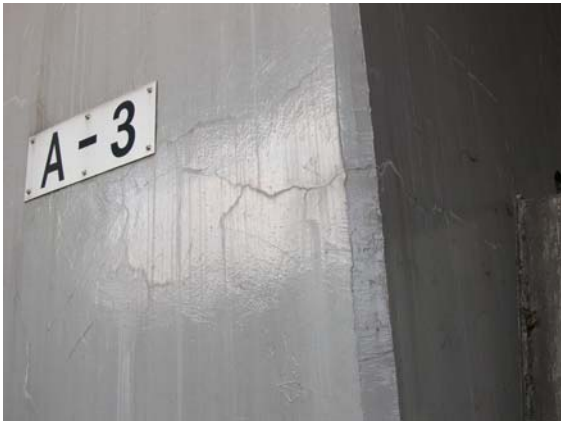
写真 3.10 リチウム注入箇所の再劣化