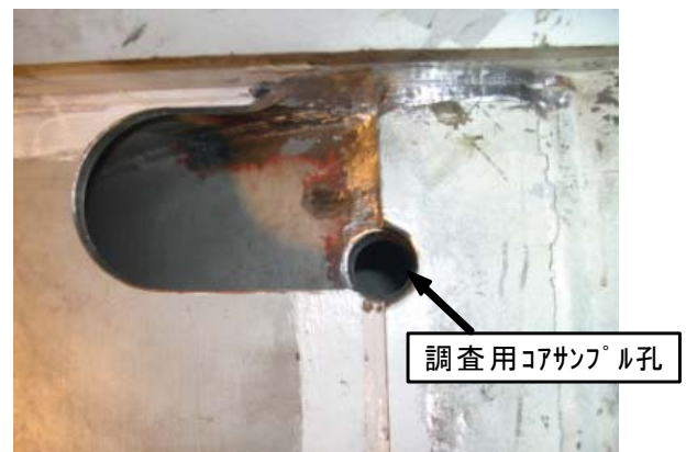
写真 3.4 横梁ウェブ上端のスカラップ施工