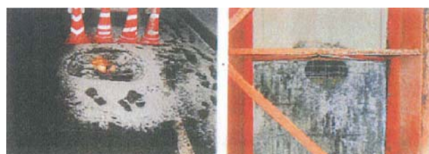
写真 3.1 RC 床版の抜け落ち

フォローアップ調査の結果としては、写真 3.2 に見られるように、既設床版や打換え部等にひび割れ箇所が見られたが、漏水箇所や極端に劣化が進行している箇所は見られず、当面の耐久性は確保されているもの