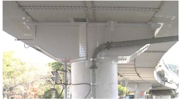
写真 3.3 ブラケット補強

当該橋梁は 3 径間連続鋼床版 2 箱桁橋である。き裂は箱桁間をつなぐ横桁部よりもブラケット側の隅角部の方が大きい傾向が見られ、面内剛性の高いダイヤフラム部の損傷程度が中間横リブ部よりも大きかった。損傷原因については、橋軸方向に特定の傾向が見られ