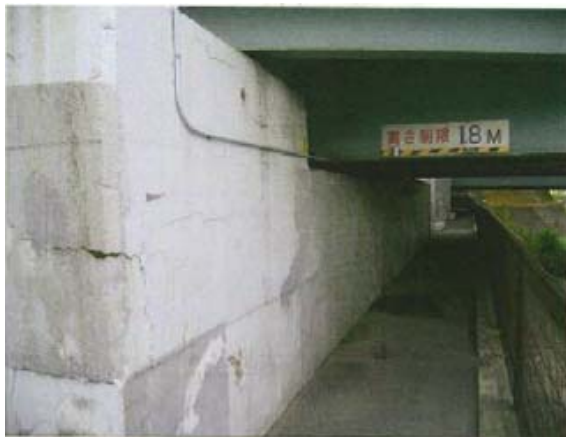
写真 3.7 表面被覆再劣化、ひび割れの再発

視ではき裂の進展は確認されなかった。また、新たなき裂の発生も見られないことから、構造そのものの見直しが効果を上げていると考えられる。