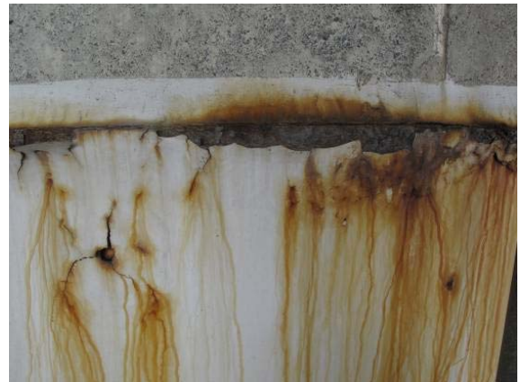
写真 3.13 鋼板上端部の腐食