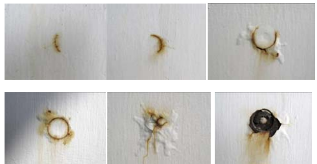
写真 3.14 皿ボルト部の腐食の進展

なる 5 径間の高架橋であり、海岸に近接して立地している。なお、当該橋梁は昭和 50 年に設計されたものであり、平成 9 年に曲げ耐力制御式鋼板巻立て工法により耐震補強がなされている。