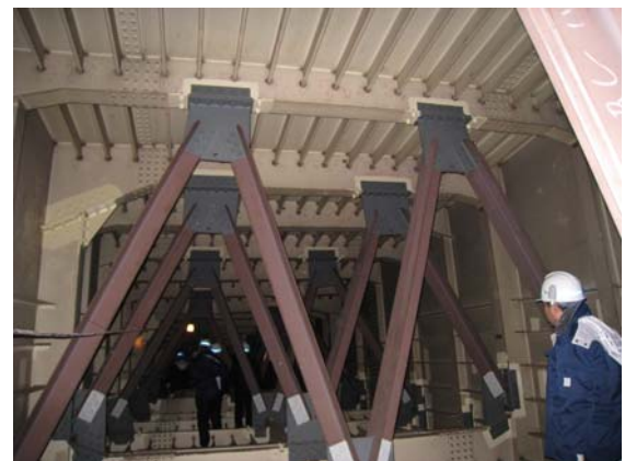
写真 3.5 ダイヤフラムの補強

ないことから、外側車線の車両の走行による繰り返し荷重に起因して、ダイヤフラムコーナー部（垂直部材フランジの控えリブのない部位）に応力集中が生じたためと考えられる。補修・補強においては、ダイヤフラム隅角部の損傷が激しいため、平成 3 年に 写真 3.5 に示すような、トラス組によりダイヤフラムの構造自体を補強している。