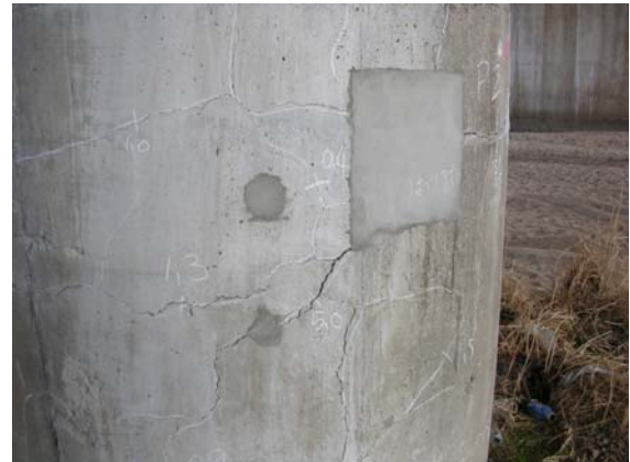
写真 3.8 ひび割れの発生状況（はつり部あり）

補修・補強においては、平成 20 年に鋼材腐食及び ASR による劣化範囲を除去し、断面修復を行い、腐食抑制効果を持つシラン系表面含浸材を表面に塗布している。また、破断している鉄筋は置き換えられている。