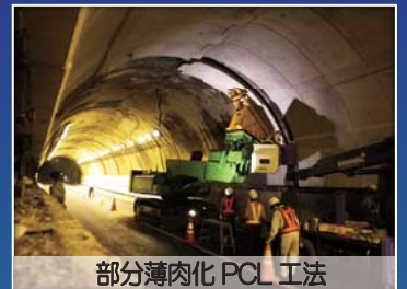
部分薄肉化 PCL 工法

展示・技術相談コーナー 9:30 ~ 18:00 の間は、講演技術をはじめ土研の新技術等についてパネル等を展示し、技術相談をお受けするコーナーを設けます。 特に、12:15 ~ 13:30、15:25 ~ 15:45、17:00 ~ 18:00 の間は、各技術の講演者または開発者が直接技術相談をお受けします。