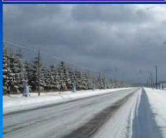
北海道内の国道における整備延長 約300km