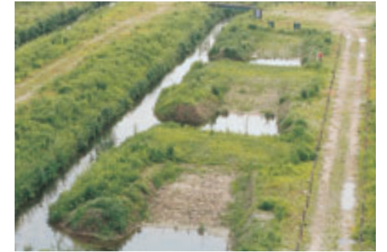
実験河川のワンド

このように、ワンドは多くの魚類にとって重要なハビタットになっています。当センターでは、今後もワンドの調査・研究を継続的に行い、ワンドと生物の関係について明らかにしていく予定です。