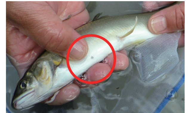
図2 IC タグを取り付けたアユ