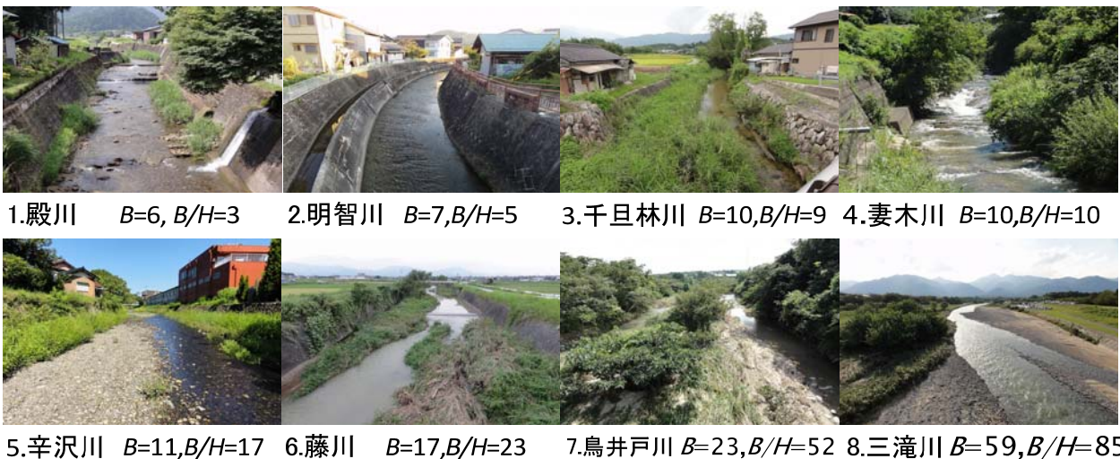
図 2 川幅( B )および川幅水深比( B/H )と河川景観との関係

参考文献 1)原田ら：中小河川の断面形状と河道粗度設定手法の変遷に関する考察，土木学会論文集 B1(水工学)，vol.68(4)，2012. 2) Frissell, C. A. et al.: A hierarchical framework for stream habitat classification-Viewing streams in a watershed context. Environmental Management, Vol. 10(2), 1986. 3) 黒木ら：中規模河床形態の領域区分に関する理論的研究，土木学会論文報告集，vol.342，1984.