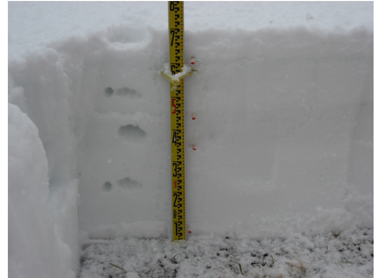
積雪断面観測値 (構内 2020/12/25)