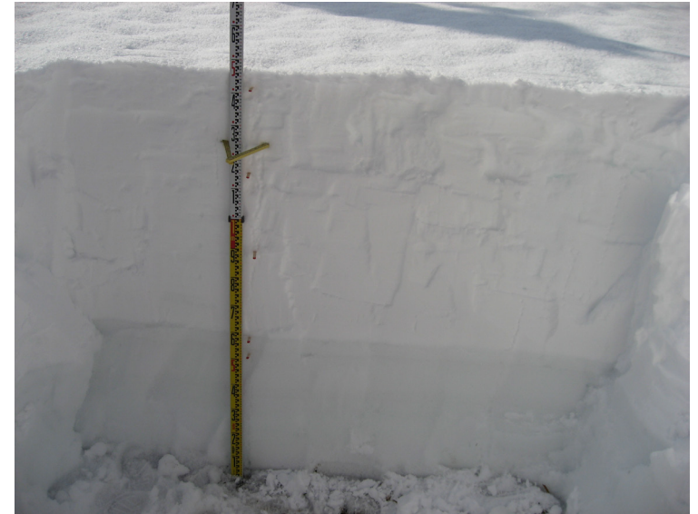
積雪断面観測値 (構内 2021/01/05)