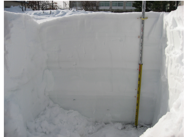
積雪断面観測値 (構内 2021/01/15)