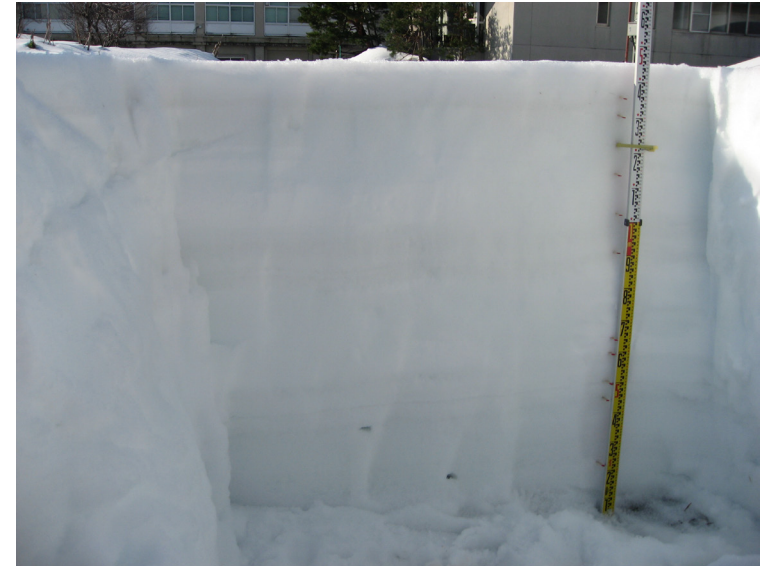
積雪断面観測値 (構内 2021/01/25)