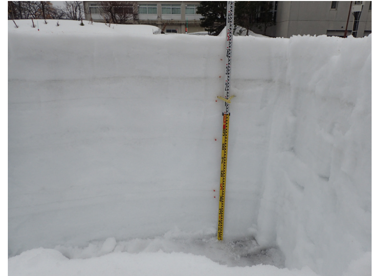
積雪断面観測値 (構内 2021/02/15)