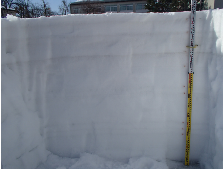
積雪断面観測値 (構内 2021/02/25)