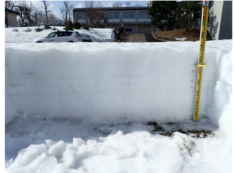
積雪断面観測値 (構内 2021/03/15)