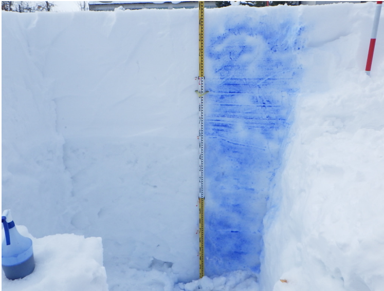
積雪断面観測値 (構内 2022/02/25)