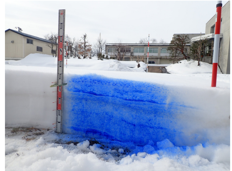
積雪断面観測値 ( 構内 2023/02/24 )