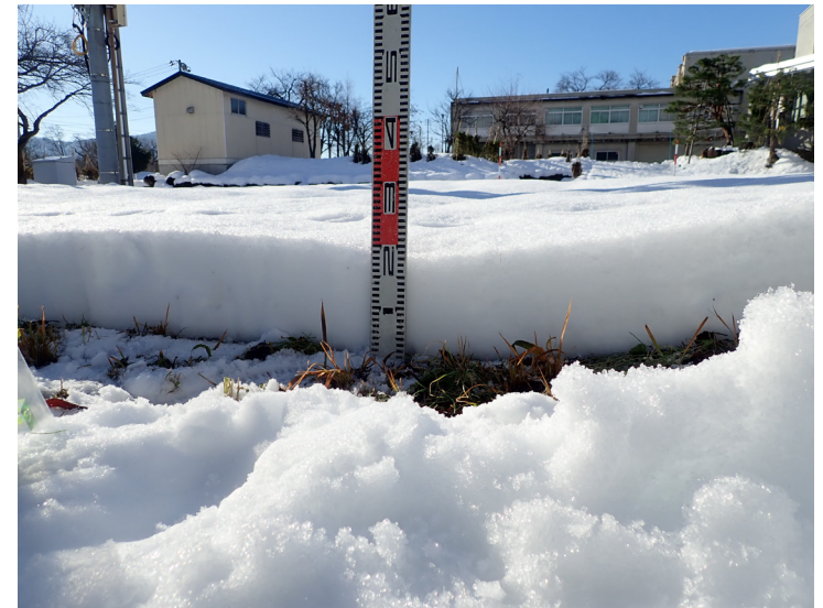
積雪断面観測値 ( 構内 2023/12/26 )