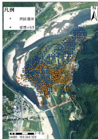
図-2 イタチの行動データとモデルによる再現結果の比較