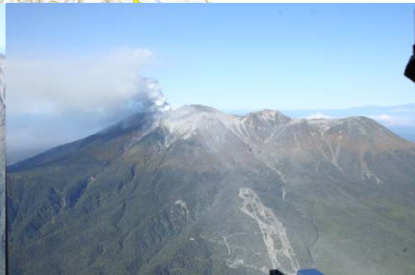
御岳湖 山頂から御岳ロープウェイ スキー場にかけて降灰が見られる